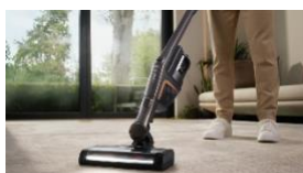
Photo 1 : Le nouveau Miele Triflex HX2 convainc avec 60 % de puissance en plus par rapport à son prédécesseur ,grâce au nouveau moteur Digital Efficiency, à la brosse électrique Multi Floor XXL et à la technologie Vortex.