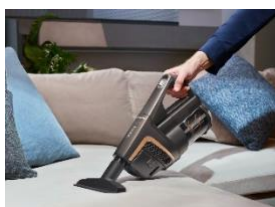
Photo 2 : Un appareil aux multiples talents : qu'il soit utilisé comme aspirateur "normal" ou comme aspirateur à main, le Triflex HX2 peut être rapidement transformé. La PowerUnit, composée d'un bloc moteur, d'une batterie et d'un compartiment à poussière, en est la pièce maîtresse. (Photo : Miele)

Photo 1 : Le nouveau Miele Triflex HX2 convainc avec 60 % de puissance en plus par rapport à son prédécesseur ,grâce au nouveau moteur Digital Efficiency, à la brosse électrique Multi Floor XXL et à la technologie Vortex. (Photo : Miele)